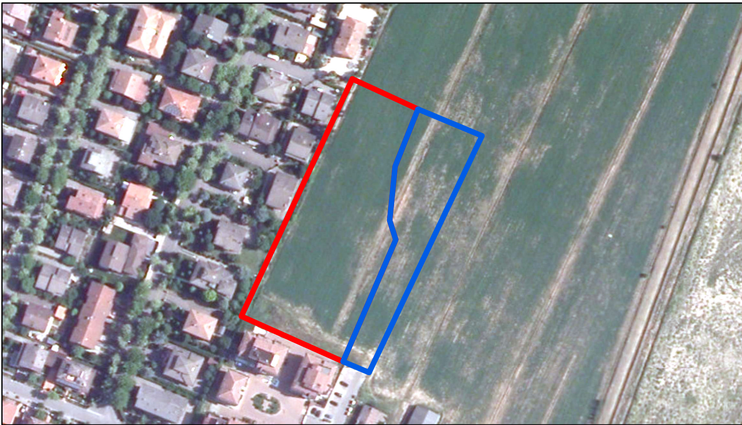
estratto ortofoto - Agea 2011 sc. 1:2000