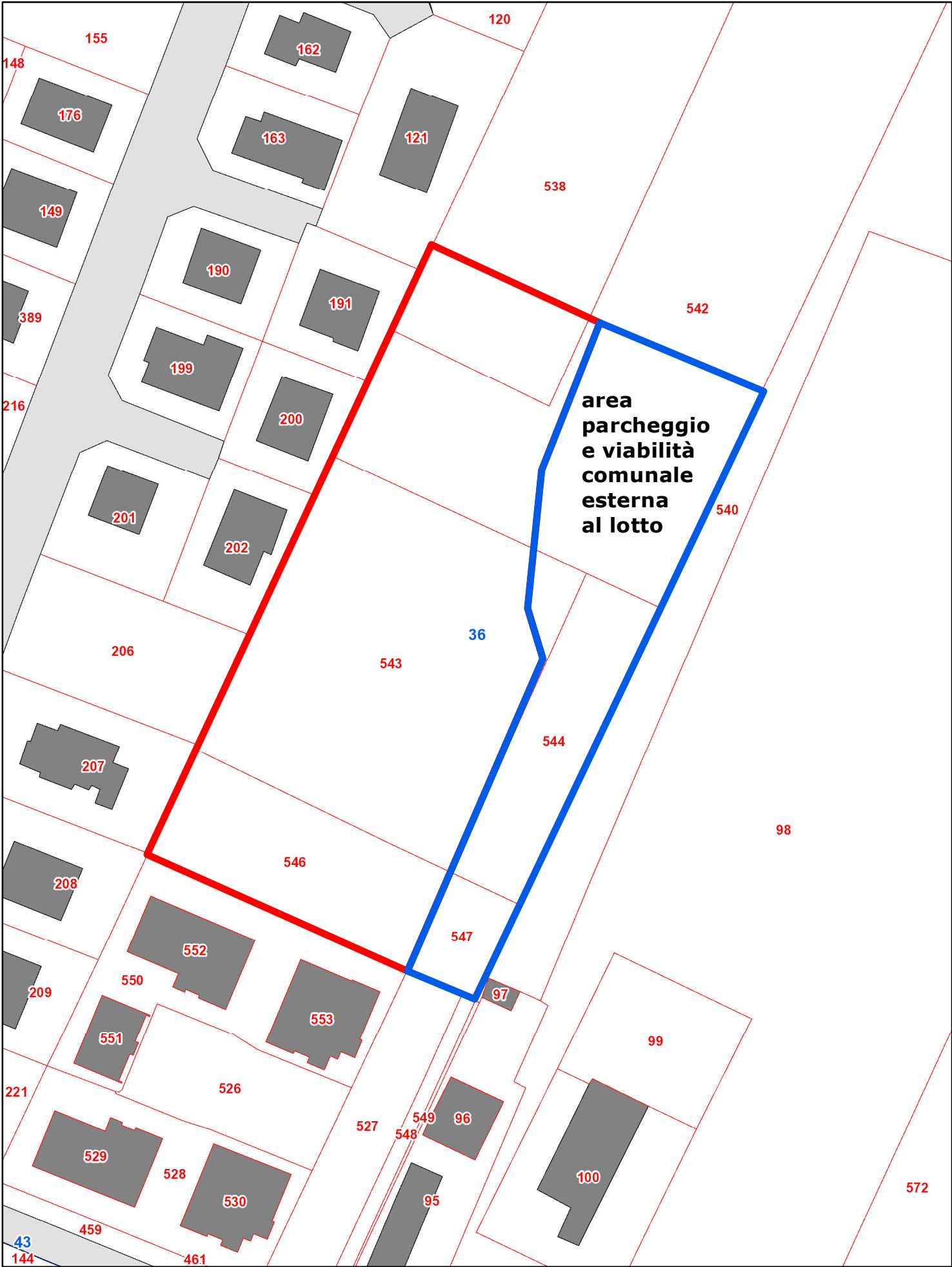
estratto catastrale Fg 36 map.le 538 parte, 542 parte, 543, 544, 546, 547 sc. 1:1000